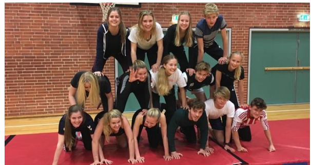
Akrobatik i 9.A

"Generelt synes jeg at det er godt at vi får karakterer, og det har givet mere motivation, men det er også blevet kedeligere"