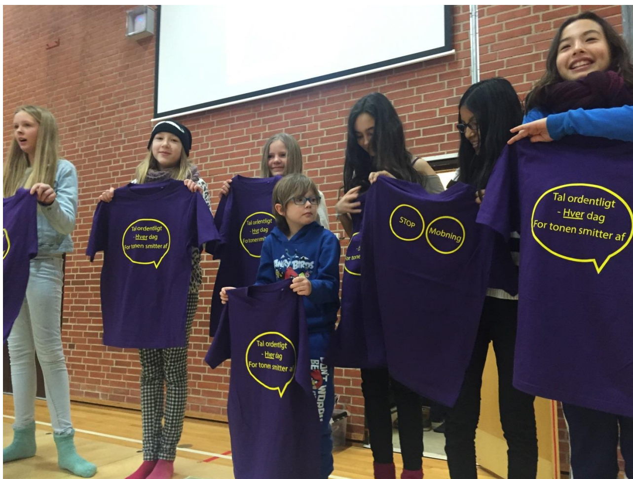
Elevrådets konkurrence om "God stil på Birkerød Skole"

Indskolingen arbejder med at tale pænt til hinanden for at gøre Birkerød Skole til et endnu bedre sted at være. Der har været afholdt fællessamlinger for 0.-6. klasse i Hallen den 8. januar og 5. februar.