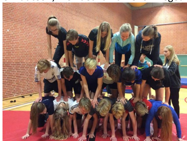
Akrobatik i 9.C

Generelt synes vi, det er godt at idræt er blevet et prøvefag. Vi har fået mere motivation, og folk deltager meget mere i faget. Det er til dels også rart at der er kommet lidt mere seriøsitet i faget, selv om det bliver lidt kedeligt en gang imellem. Det er et minus at der er kommet så meget teoriundervisning ind i faget. Vi har oplevet nogle gange, hvor idrætstøjet ikke har været i brug og i stedet for at se andre udøve idrætten, vil vi hellere, som elever selv prøve at udøve de forskellige idrætsdiscipliner. Selvfølgelig synes vi at det er godt, at der er lidt teori, men det kan blive for meget.